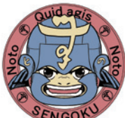
箸置きのデザイン ©宮下英樹/スタジオセンゴク

宮下さん提供のオリジナルガラス箸置きをプレゼントします。詳細は当館ホームページでお知らせします。