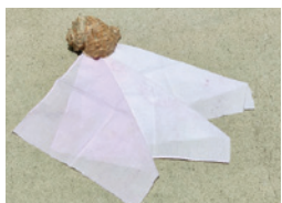
ニシ貝と貝染めした布