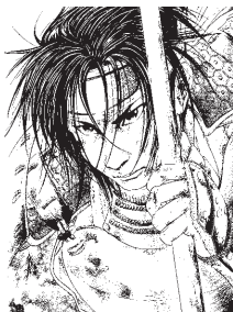
「センゴク」コミック1巻表紙の下絵 ©宮下英樹/スタジオセンゴク