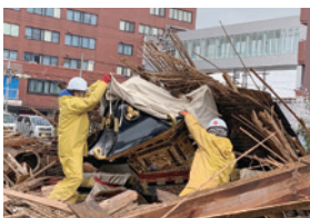
西宮神社(富岡町)の資料救出時の様子