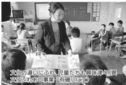
文化の違いにふれ、児童たちも興味津々(異文化ふれあい事業 有磯小にて)

異文化ふれあい事業で、5月から11月にかけて市内の全小学校全クラスを訪問し、児童たちに中国の歴史・文化・古くから伝わる遊びなどを紹介しました。楽し気の中、給食も一緒に食べました。