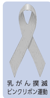
乳がん撲滅 ピンクリボン運動

※上記年齢は、今年度中（平成21年4月2日～平成22年4月1日）に迎える年齢です。