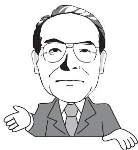
七尾市長 武元 文平

皆さまが生きてこられた激動の時代のことを、若い世代、子や孫に話してください。特に、戦中戦後の苦しく辛かったこと、子どもを育て家族を養うためにどんな生活をし、どんな苦労をして今日があるのか。一人ひとりの生活や人生の中で経験し、そこから学んだ知恵や人観、もの見方や歴史観は、どんなに偉い学者の話よりも実があり役に立つものだと思う。高齢者が体験され、蓄積された知識の量は大きな図書館と同じ。この図書館に詰まった情報を若い者に発信し伝えてください、とお願いしている。