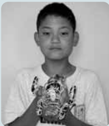
「デラックススポーツカー」