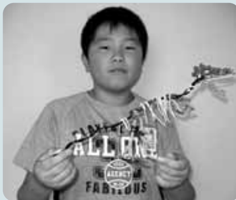
「ボーン・ティラノザウルス」