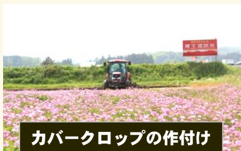
カバークロップの作付け

※ 本制度は予算の範囲内で交付金を交付する仕組みです。申請額の全国合計が予算額を上回った場合、交付額が減額されることがあります。